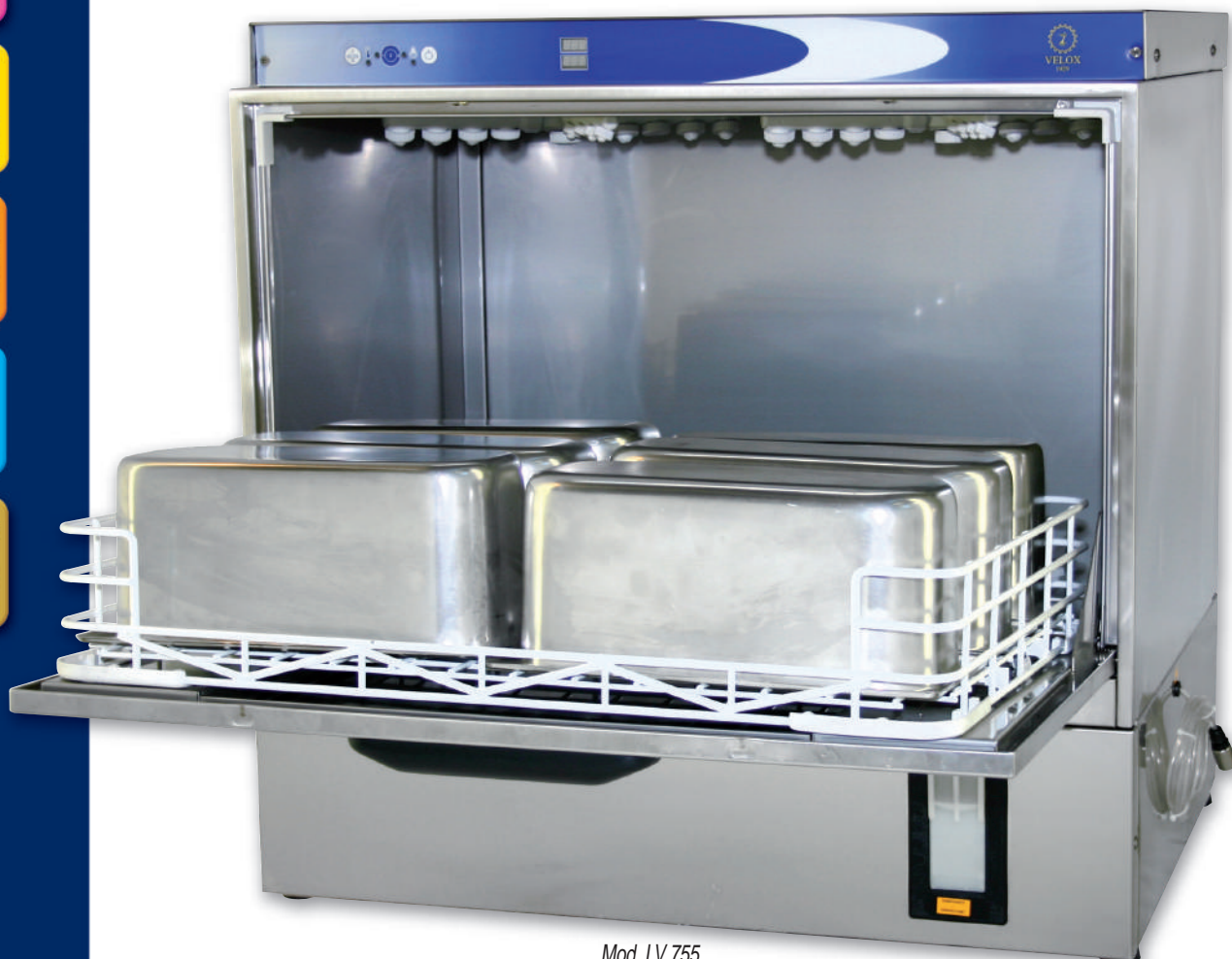
Mod. LV 755

UNTER-DEM-TISCH SPÜLMASCHINE, AUSH MIT AUTOMATISCHEM DESINFZEKTIONSSYSTEM.