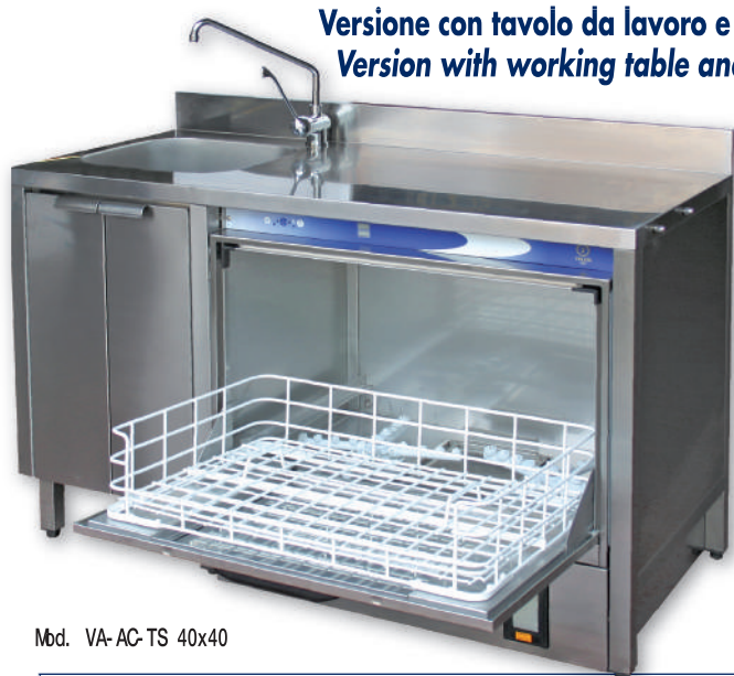
Mbd. VA- AC- TS 40x40