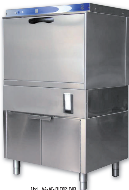
Mbd. VA- AC- BLC6PI EAR